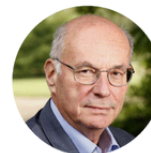
Dr. Boris Cyrulnik