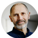
Dr. Christophe André

Médecin psychiatre, Christophe André a exercé dans le Service Hospitalo-Universitaire de l'hôpital Sainte-Anne à Paris, au sein d'une Unité de Psychothérapie Comportementale et Cognitive.